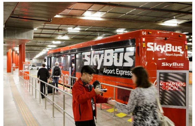
サザンクロス駅内スカイバスのりば

尚、サザンクロス駅からスカイバスに乗る際にもまずは販売機でチケットを購入し、「メルボルン空港行き」のスカイバスのりばで乗車します。(注:「アバロン空港」行きと間違わないように)